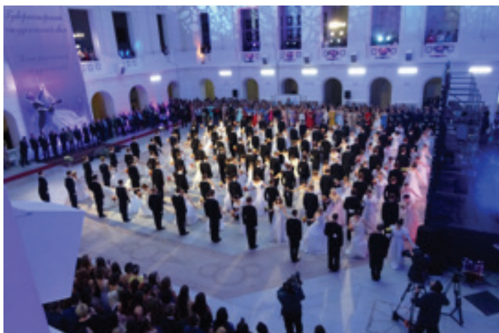
Grand Bal annuel de l'Ecole Polytechnique de Novotcherkassk