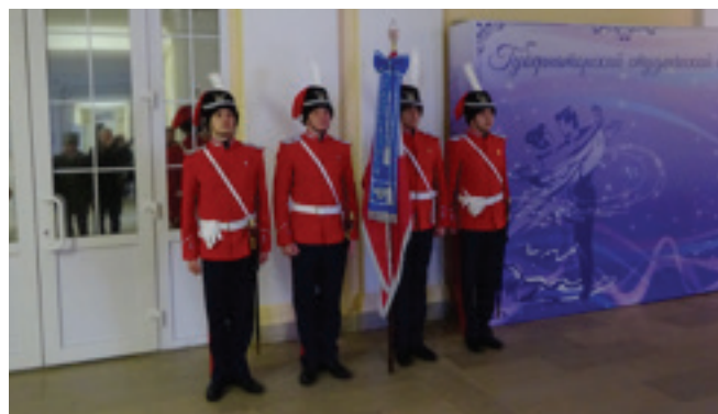
Garde d'honneur du drapeau de l'Ecole Polytechnique de Novotcherkassk. Les cadets, en tenue inspirée de celle du régiment des Cosaques de Sa Majesté, présentent une copie de l'étendard de ce régiment remise à l'Ecole Polytechnique par l'Association du Souvenir du régiment des Cosaques de la Garde Impériale.